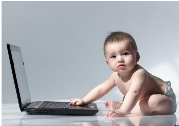
Получение доступа к АРМ членами семьи