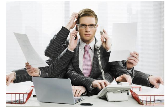
Работа на нескольких работодателях