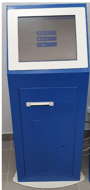
Общий вид терминалов