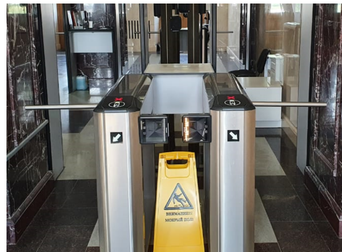
Общий вид считыватели на пешеходных КПП