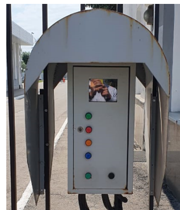
Общий вид считыватели на автомобильных КПП