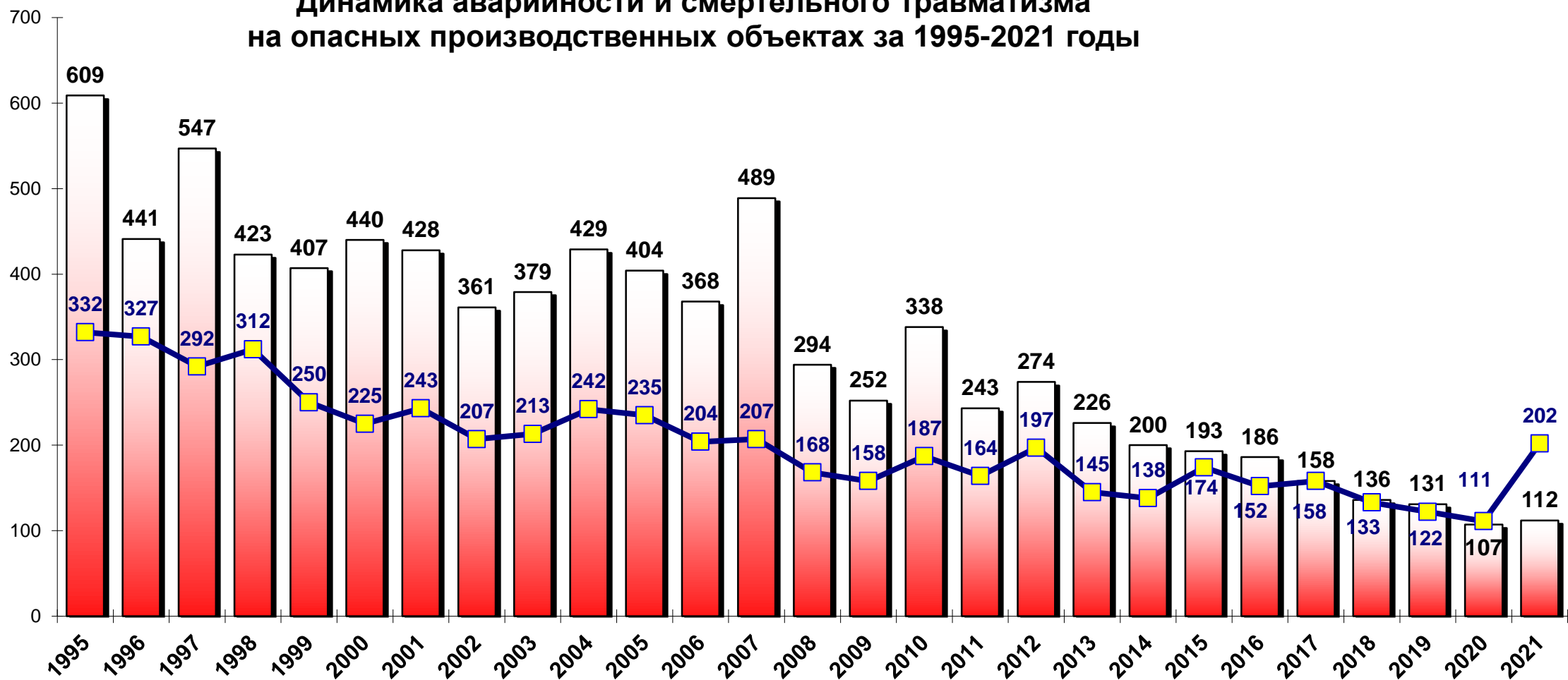
Динамика аварийности и смертельного травматизма на опасных производственных объектах за 1995-2021 годы

■ Число смертельных несчастных случаев ■ Число аварий на опасных производственных объектах