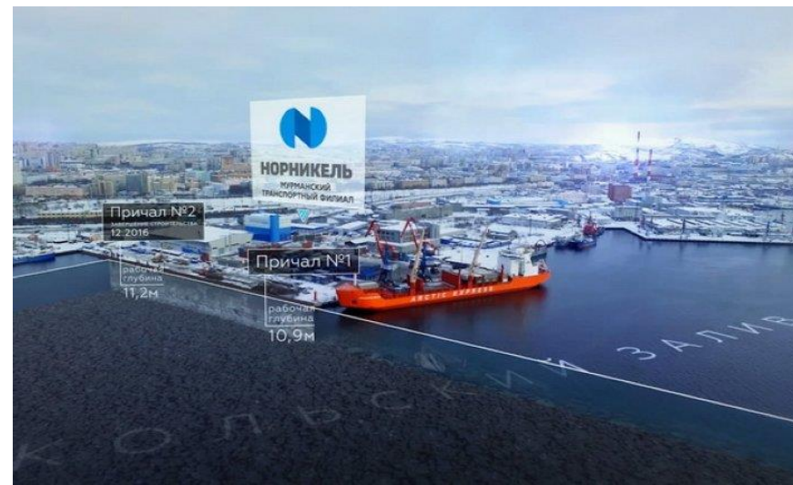
Объекты транспортного комплекса