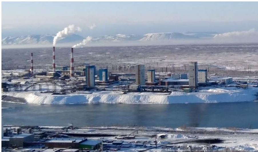
Объекты топливно-энергетического комплекса