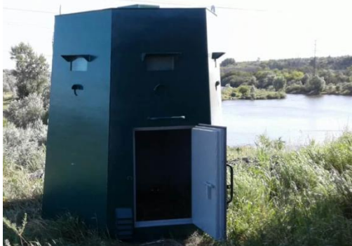
Бронеколпак для стрелка