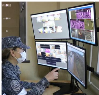
Модуль для размещения личного состава с видеонаблюдением