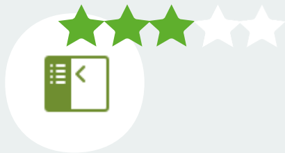
Дашборд, цифровая панель