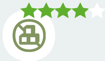
Исключение ненужных звеньев