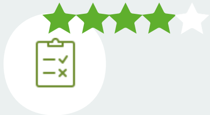
Экспертная оценка подрядчиков