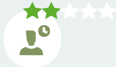
Информационно- коммуникационная платформа