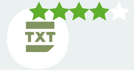
Цифровой аналог НПА